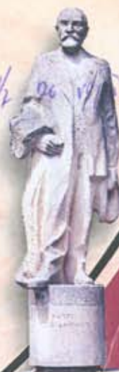
Spisovatel Karel Klostermann